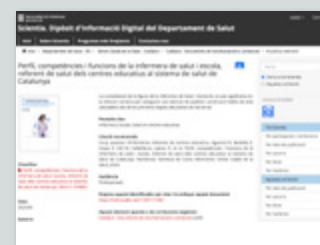
https://scientiasalut.gencat.cat Cercador -> Infermera Salut i Escola