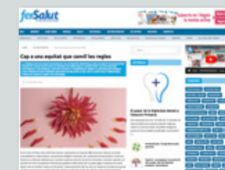
https://www.fersalut.cat En Profunditat -> Equitat menstrual