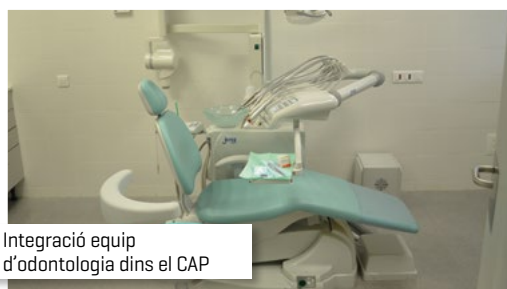
Integració equip d'odontologia dins el CAP