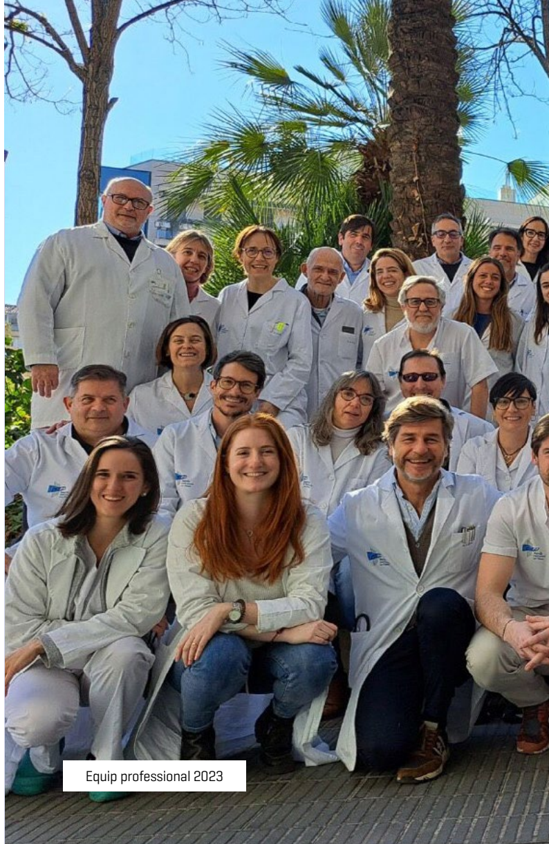
Equip professional 2023

EAP Sarrià, Vallvidrera i Les Planes @CapSarria