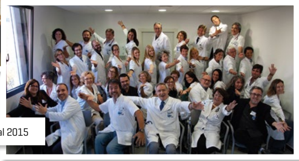
Equip professional 2015