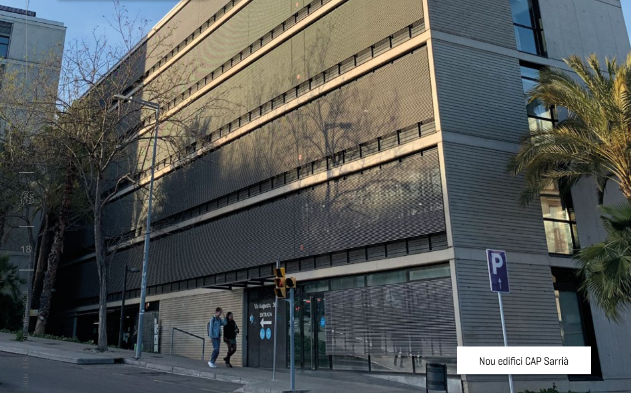
Nou edifici CAP Sarrià