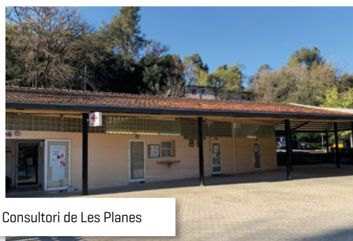
Consultori de Les Planes