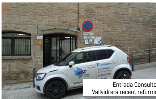
Entrada Consultori Vallvidrera recent reformat