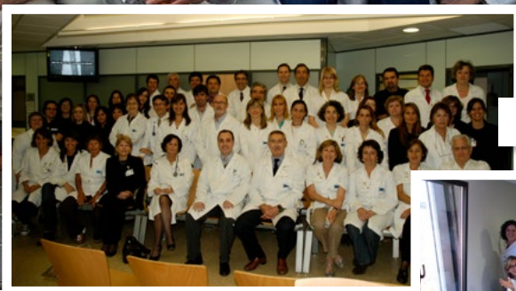
Equip professional 2008