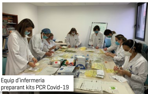
Equip d'infermeria preparant kits PCR Covid-19