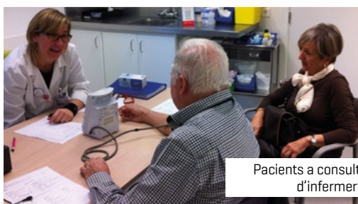
Pacients a consulta d'infermeria