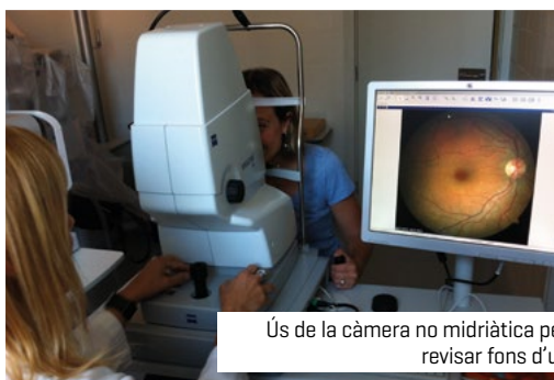
Ús de la càmera no midriàtica per revisar fons d'ull