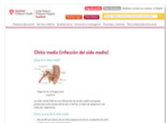
https://www.stanfordchildrens.org/es Cercador: Otitis media