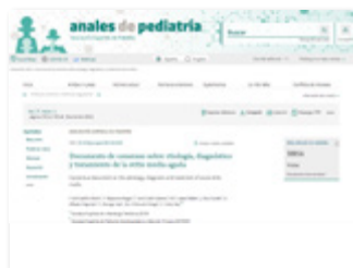
https://www.analesdepediatria.org Cercador -> Artículo otitis media aguda