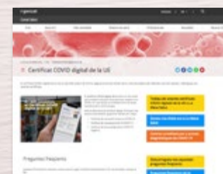
https://canalsalut.gencat.cat/ca secció: Salut A-Z -> Certificat Covid digital