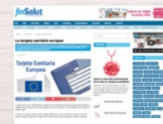
http://www.fersalut.cat secció: El teu CAP-> Targeta sanitària europea