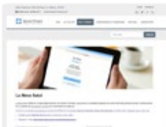
https://aprimariavsg.com secció: Info i Tràmits-> La Meva Salut