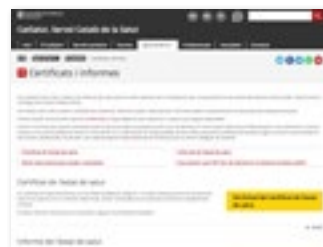
https://catsalut.gencat.cat secció: Què cal fer si-> Certificats