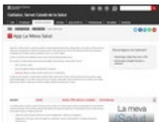
https://catsalut.gencat.cat secció: Serveis Sanitaris-> La Meva Salut