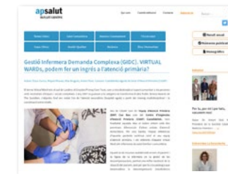
https://apsalut.cat Secció -> Gestió Infermera Demanda