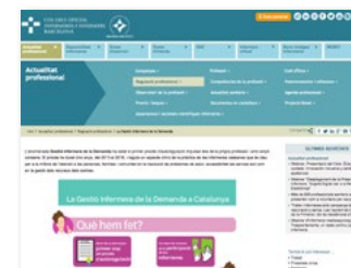
www.coib.cat Secció -> Gestió Infermera Demanda