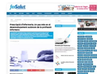
www.fersalut.cat Secció -> En profunditat