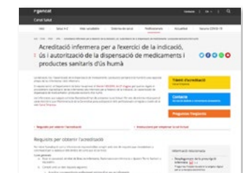
https://canalsalut.gencat.cat/ca Secció -> Professionals