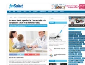
www.fersalut.cat secció: Família -> La Meva Salut