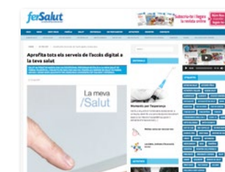
www.fersalut.cat secció: Vallcarca -> La Meva Salut