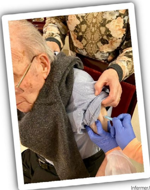
Infermer/a vacunant a un pacient amb un grau alt de dependència a atenció domiciliària