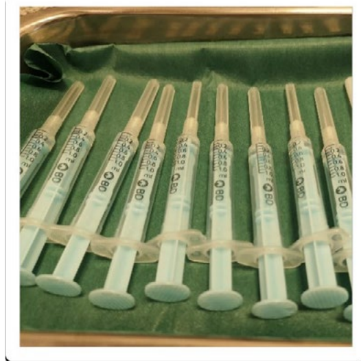
Reconstituïció del vacci Pfizer/BioNTech

Seguidament, es va procedir a la vacunació el qual va ser el punt més crític per l’organització, sincronització i mobilització de recursos humans que requeria, ja que la vacuna escollida presentava una alta labilitat, ja reconstituïda, i limitant així la seva mobilitat amb vehicle motoritzat. Degut a aquesta limitació, vam constituir equips per fer una distribució homogènia i de fàcil accés pels professionals en les diferents zones i barris de l’EAP VIC.