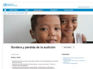
https://www.who.int/es secció: Temes de salut-> Sordera