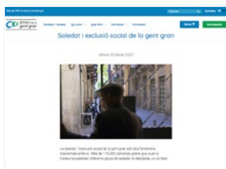
https://amigosdelosmayores.org/ca secció: Soledat i vellesa