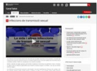
canalsalut.gencat.cat secció: Salut A-Z