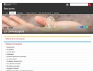
sexejoves.gencat.cat secció: temes/contracepció